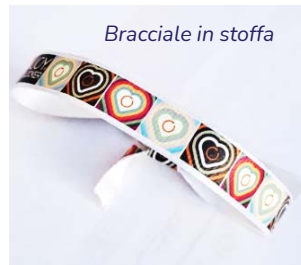
foto di prototipi realizzati